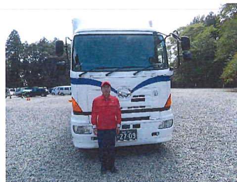
【担当ドライバーから一言】

ABS、エアバック、衝撃吸収ハンドル、車線逸脱警報、ドライバーモニターなどの標準装備はもちろん、追突被害軽減機能、VSC横滑り防止、車両ふらつき警報、バックカメラなどの数々の特別装備の安全装備を装着しています。