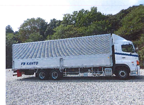
【宇都宮工場 工場長より一言】

各企業の商品、品質を維持するためには、安全運転に心がけが必要、不可欠となります。