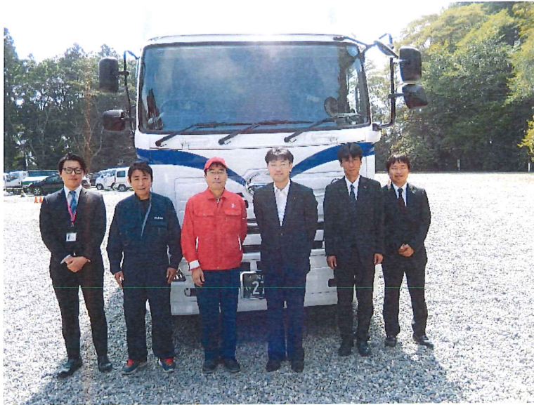
【日野自動車製トラック「PROFIA」】