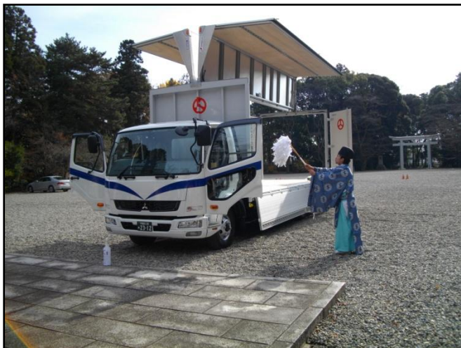
↑ 宇都宮市の護国神社にて安全祈願